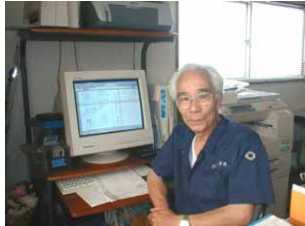
左の写真は、相馬にて