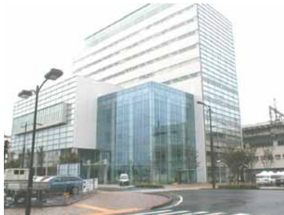
オープンしたコラッセふくしま

最後に組合員の皆様の組合運営に対するご理解と新たなる活路を見出す為にも、ご協力下さいます様お願い致します。