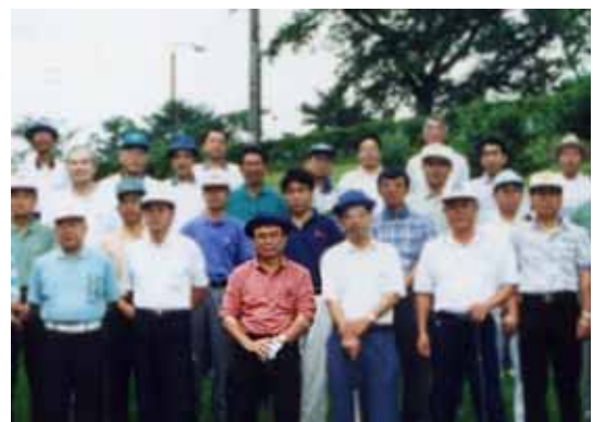
福製協力会ゴルフコンペにて