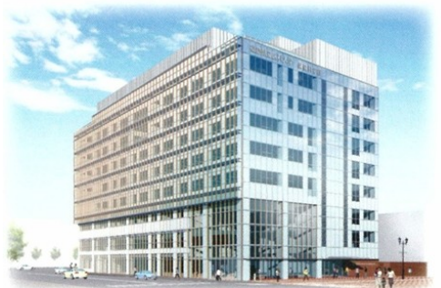
保健科学部(仮称)キャンパスのイメージ

令和3年4月開設を目標に計画が進められている新学部は、運動機能回復のスペシャリストを養成する理学療法学科（定員40名）、日常生活行為向上のスペシャリストである作業療法学科（定員40名）、最先端機器を活用し病気を発見・治療する放射線のスペシャリストを育てる診療放射線学科（定員25名）、医師とともに患者さんの身体の情報を正確に検査し、病気のサインを見つけるスペシャリストを養成する臨床検査学科（定員40名）で構成され、4