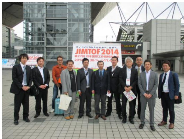
JIMTOF2014 東京ビッグサイトにて

◎青年部会では随時会員を募集しております。48歳未満の後継者の方は、是非とも入会をご検討ください。入会希望の方は組合事務局へお気軽にお問い合わせください。