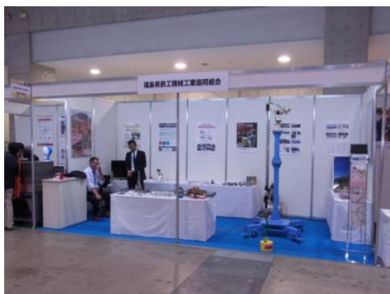
東京ビックサイト 出店風景